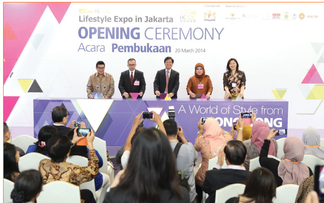
时尚生活汇展● 印尼雅加达 (2014年3月)

每年超过 340 项全球推广活动 举办 510 项交流会或外访团 接待约 740 个访港贸易团