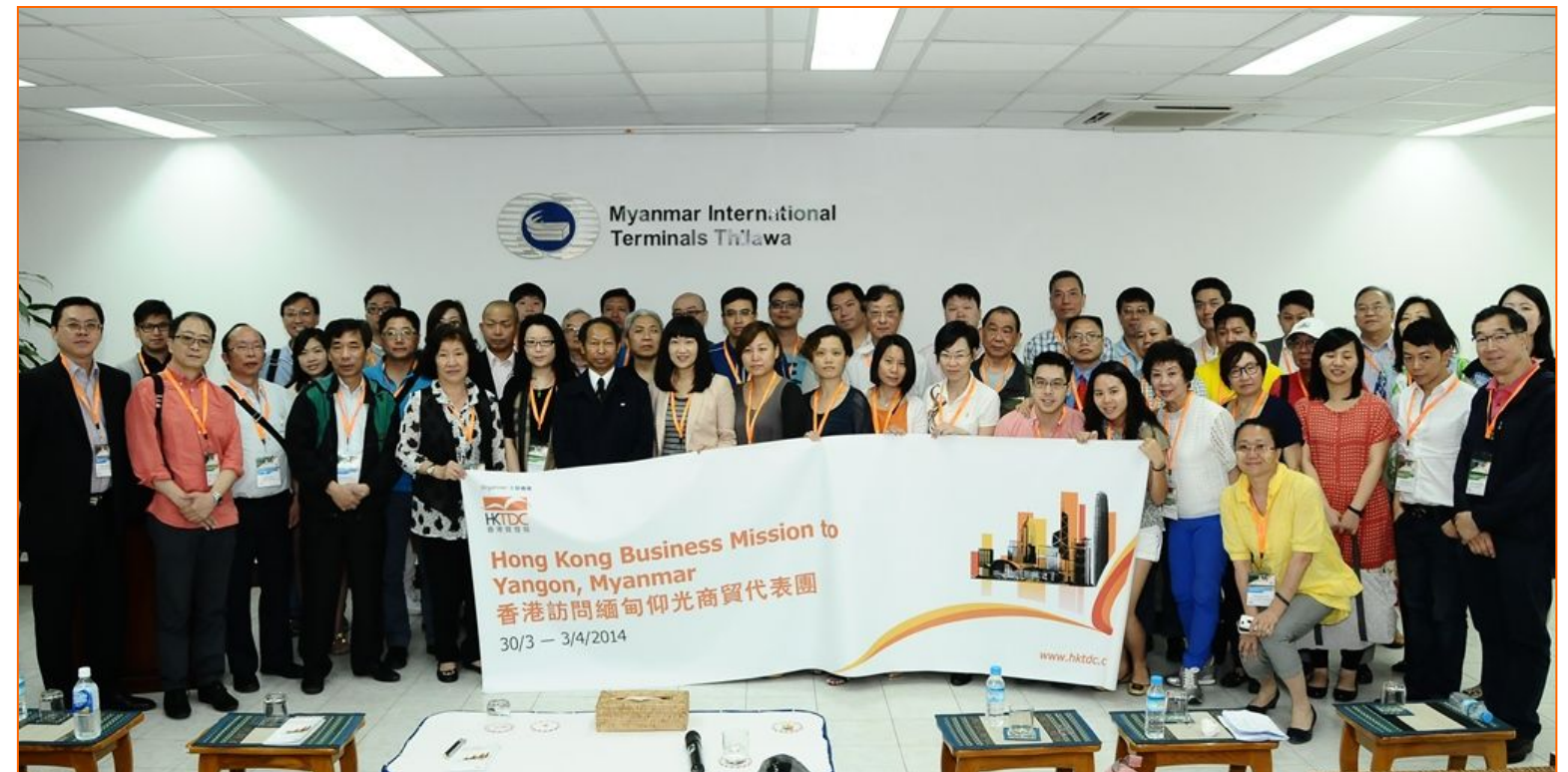
香港经贸代表团访问 缅甸 (2014年3月)

每年超过 340 项全球推广活动 举办 510 项交流会或外访团 接待约 740 个访港贸易团