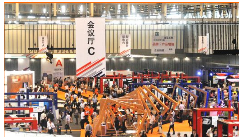
转型升级 ● 香港博览 (南京) (2014年6月)