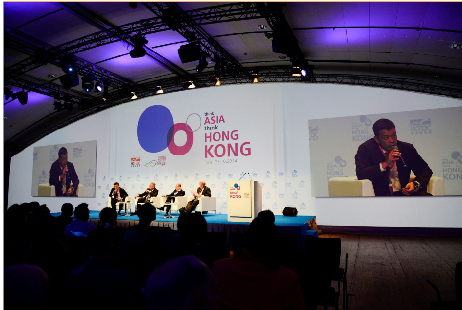
法国巴黎、意大利米兰 迈向亚洲 首选香港(2014年10月)