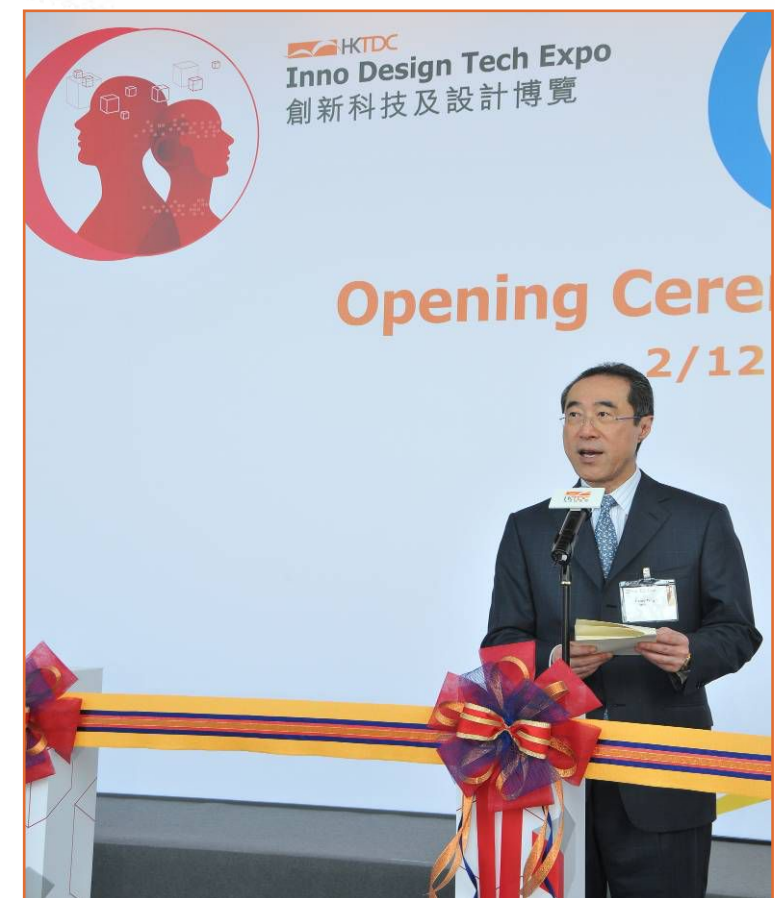
设计及创新科技博览