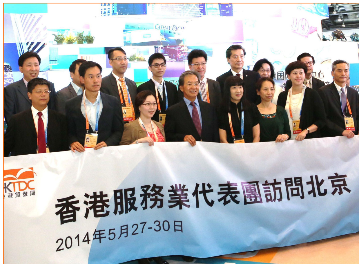
第三届中国（北京）国际服务贸易交易会(2014年5月)