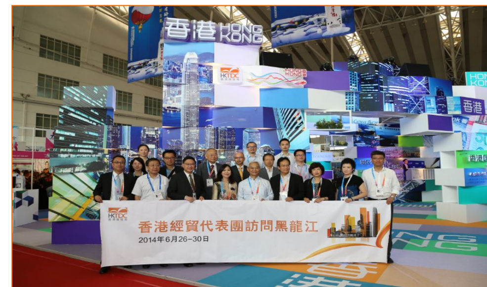
香港经贸代表团访问黑龙江(2014年6月)