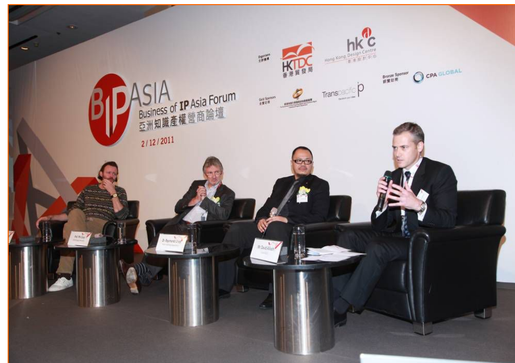
亚洲知識產權營商论坛