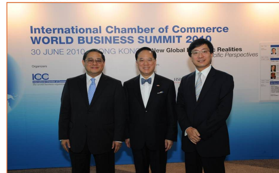
国际商会世界高峰论坛